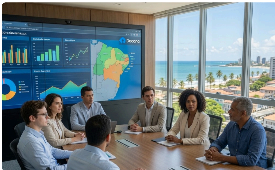
Fig. 4: Do painel da sala de situação ao WhatsApp do gestor, a mesma base de conhecimento institucional.

Licenciamento SaaS com suporte sob SLA, manutenção corretiva e evolutiva e atualizações tecnológicas mensais.