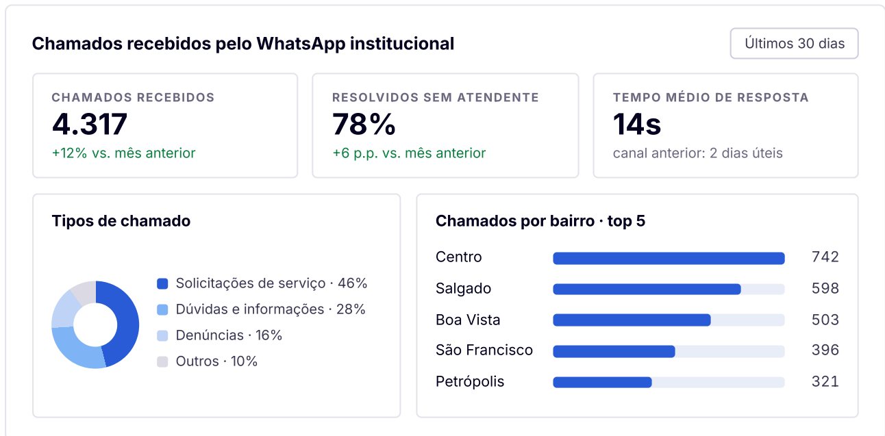
Fig. 2: Exemplo de painel gerencial. Cada interação vira um dado estruturado (tipo, bairro, resolução), com registro e trilha de auditoria. Dados ilustrativos.

Toda consulta, ação e resposta fica registrada com trilha de auditoria determinística: qual documento, qual registro, qual linha fundamentou cada resultado.