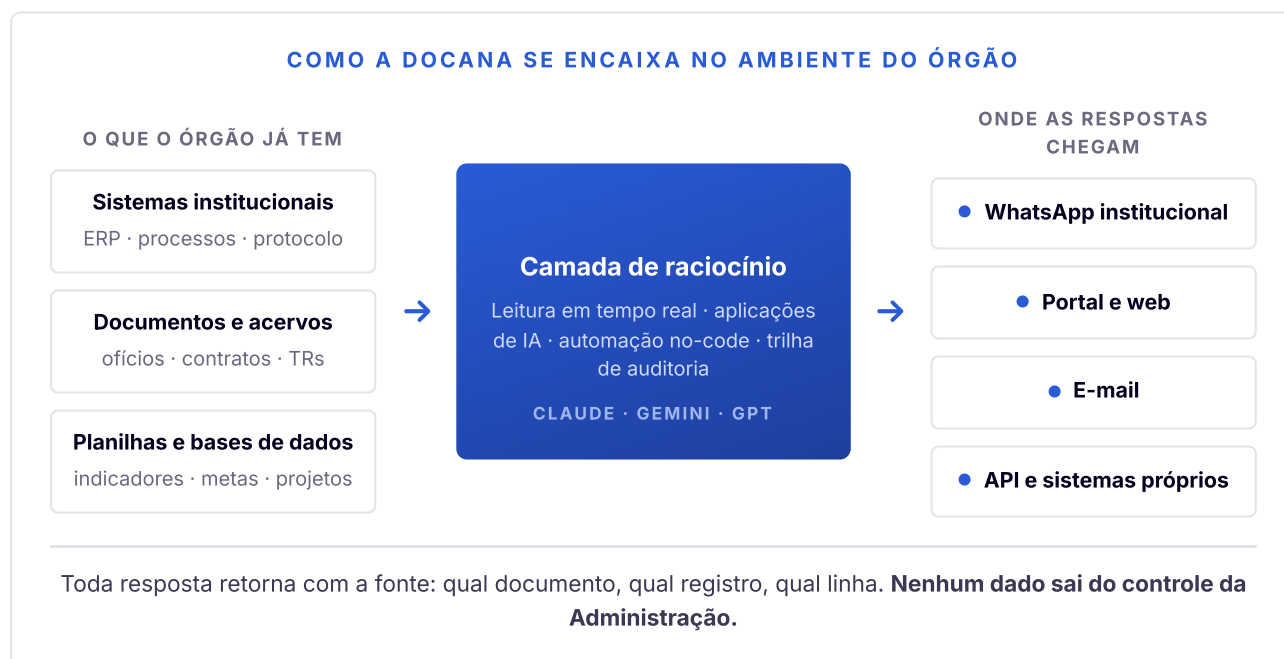
Fig. 1: A Docana opera como camada sobre a infraestrutura existente, sem migração e sem substituição de sistemas.

Construída sobre os modelos de IA mais avançados da atualidade (Anthropic Claude, Google Gemini e OpenAI GPT), a Docana já opera em produção em empresas de capital aberto e em órgãos públicos, em processos que exigem exatamente o que a Administração exige: precisão, auditabilidade e defensabilidade de cada resposta.